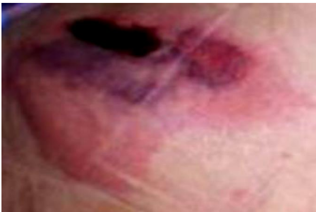
Figura 8: Evolución de la lesión del sacro. (Fuente: Guinot-Bachero J, et al.) (17) .

Durante las 48 horas siguientes, las lesiones siguen agravándose progresivamente, tanto en extensión, como en profundidad (Figuras 8-11), al tiempo que progresa el deterioro de la paciente que finalmente es exitus en las siguientes 48 horas.