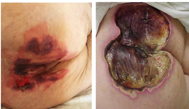
Figuras 9 y 10: Empeoramiento de lesión del sacro.

Durante las 48 horas siguientes, las lesiones siguen agravándose progresivamente, tanto en extensión, como en profundidad (Figuras 8-11), al tiempo que progresa el deterioro de la paciente que finalmente es exitus en las siguientes 48 horas.