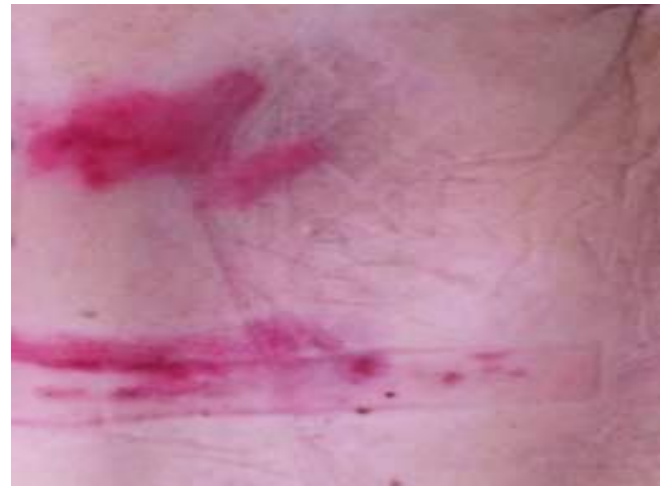
Figura 2: Lesión en espalda.

A su vez, se observa que también han aparecido otras dos lesiones, cuya característica principal es que presentan una especie de doble eritema (alguna con pequeñas áreas de color violáceo más oscuro, de mayor o menor intensidad), que podrían corresponderse con máculas y/o púrpuras, o ser secundarias a presión y/o cizalla (Figuras 3 y 4).