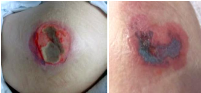
Figuras 6 y 7: Evolución de lesiones del trocánter. (Fuente: imagen 6, izquierda, cedida por Teresa Segovia; imagen 7, derecha, fuente propia).