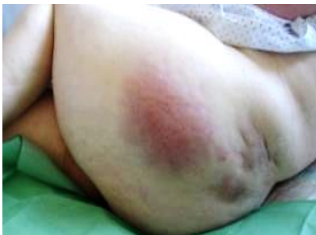
Figura 1: Lesión en trocánter izquierdo..

A su ingreso, no se había evidenciado ningún tipo de lesiones cutáneas relacionadas con la dependencia (LCRD), pero en la mañana de hoy (4º día de ingreso), coincidiendo con el aseo, se observó que presentaba varias lesiones cutáneas eritematosas, de instauración brusca, que podrían corresponderse con LCRD, si bien, no todas ellas coinciden en zonas de presión (Figuras 1 y 2).