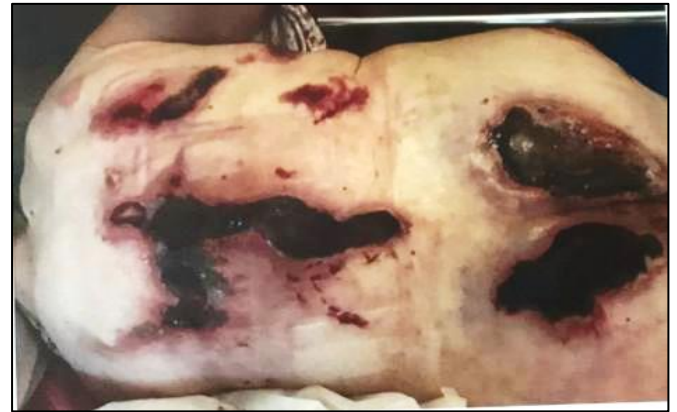
Figura 11: Úlceras de Kennedy prácticamente generalizadas, 48 horas antes de fallecer.