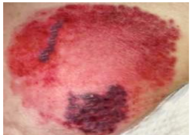
Figura 4: Lesión en trocánter derecho. (1) .

En apenas 24 horas, las lesiones progresan rápidamente, tanto en extensión como en profundidad, coincidiendo con el deterioro progresivo (y más desasosiego) de la paciente (Figuras 5-8).