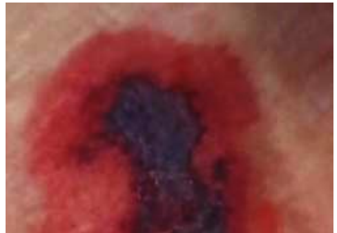
Figura 3: Lesión en zona sacra..

A su vez, se observa que también han aparecido otras dos lesiones, cuya característica principal es que presentan una especie de doble eritema (alguna con pequeñas áreas de color violáceo más oscuro, de mayor o menor intensidad), que podrían corresponderse con máculas y/o púrpuras, o ser secundarias a presión y/o cizalla (Figuras 3 y 4).