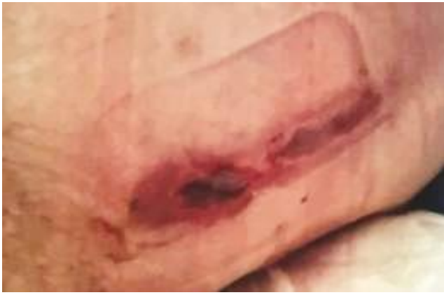
Figura 5: Evolución de lesión en espalda. (Fuente: foto cedida por Luis Arantón).